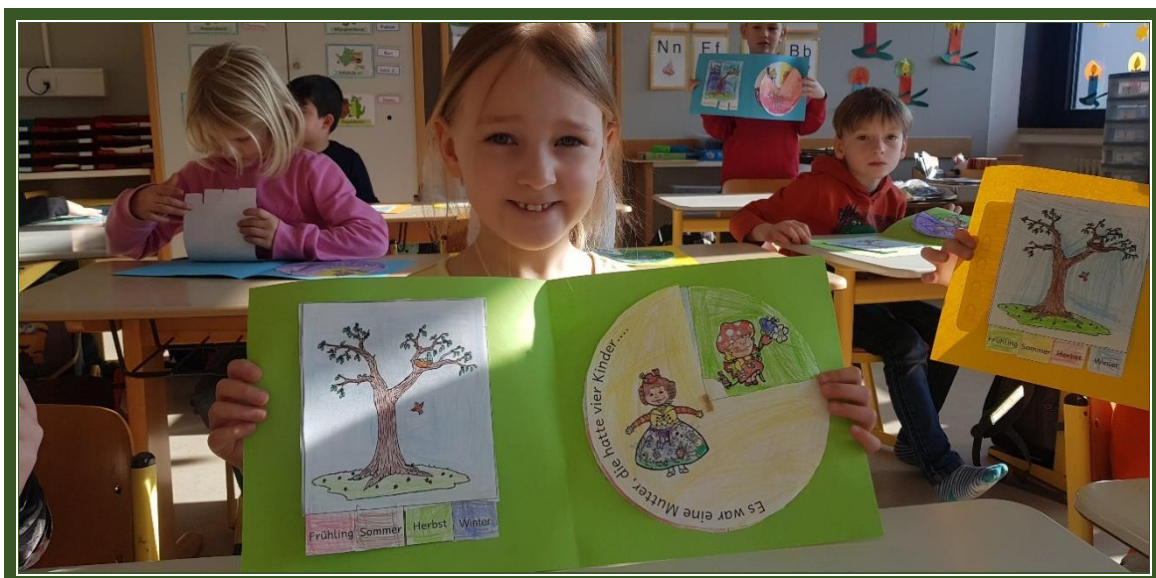
Freude nach getaner Arbeit