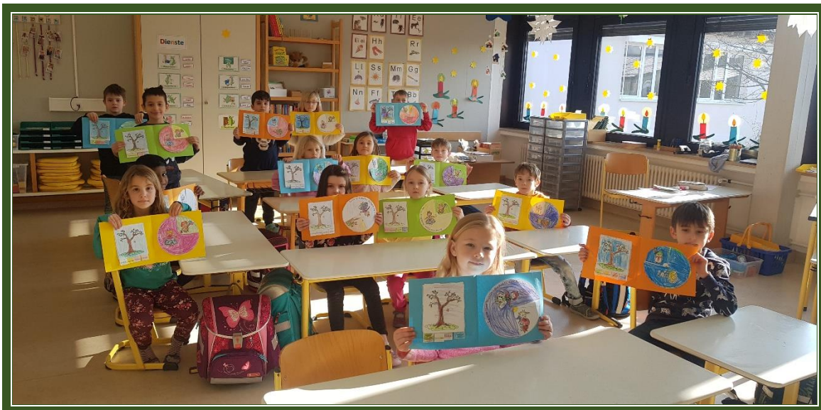
Stolz zeigen wir unsere Büchlein

„Es war eine Mutter, die hatte vier Kinder“ Fächerübergreifende Einheit Kunst / Musik