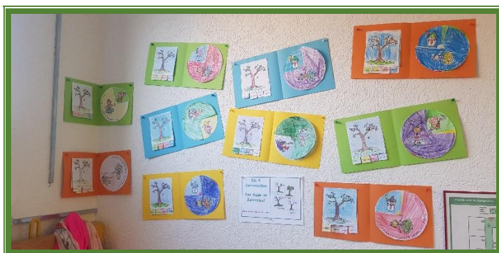
Unsere kleine Ausstellung