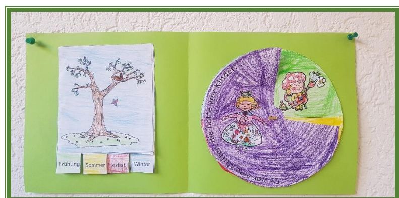
Ein Beispiel unserer Arbeit