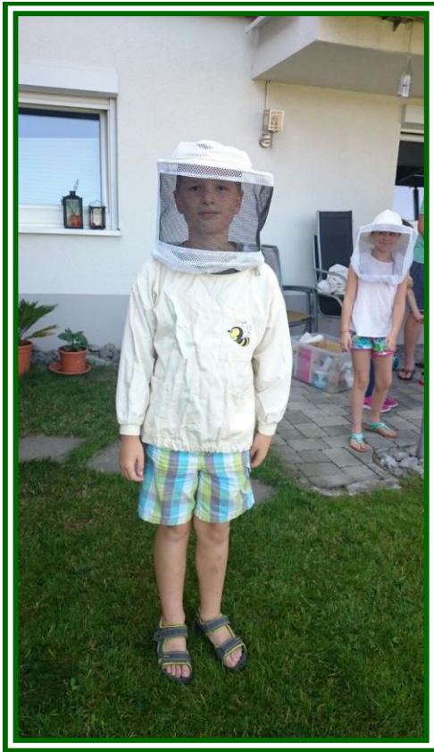
Mit Imkerhelm und Imkerjacke