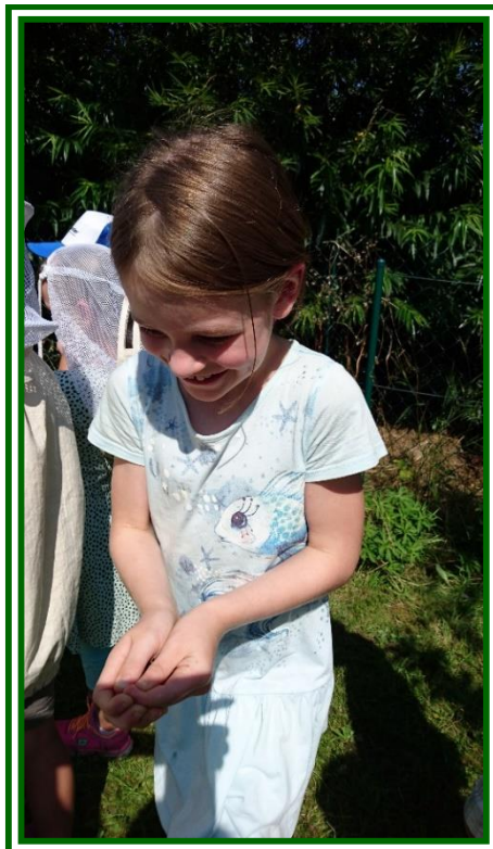
Drohnen kann man in der Hand halten. Sie stechen nicht.