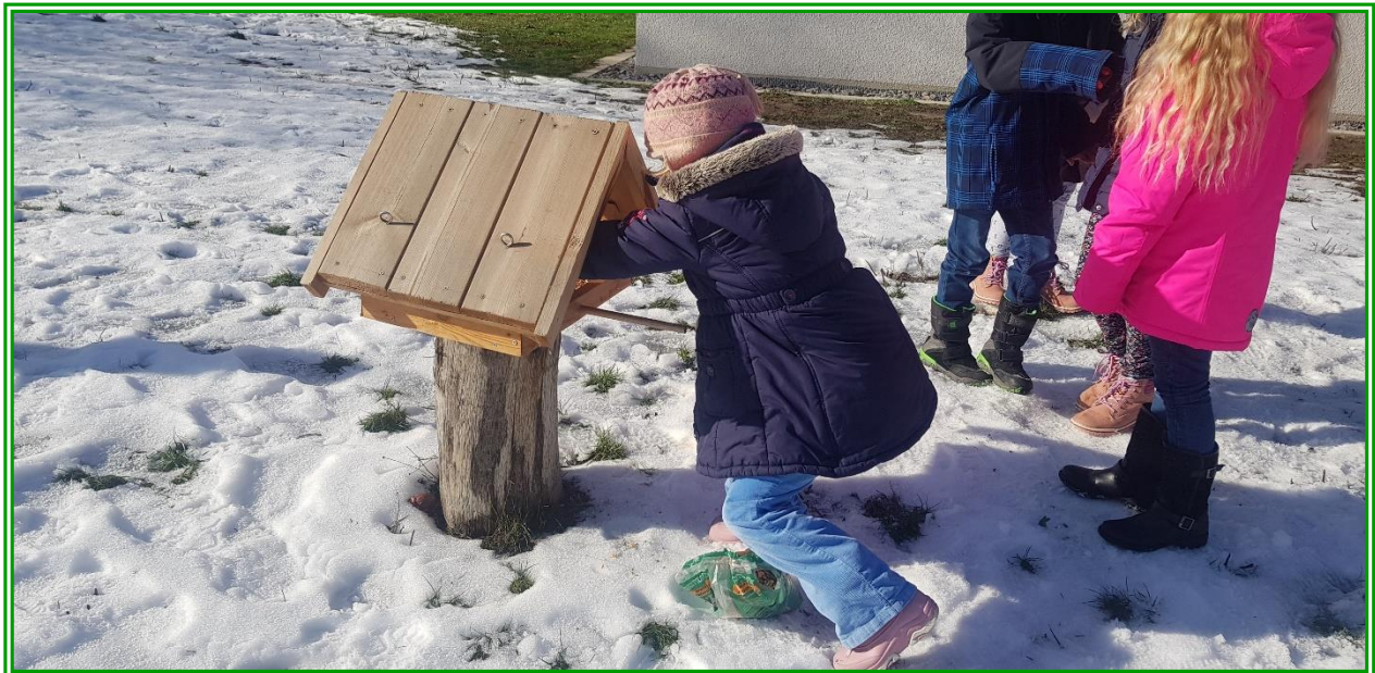
Wöchentliche Reinigung des Futterhauses und Fütterung der Vögel (Leider ist unser Standfuß defekt und zum Hängen sind die Bäume noch zu klein)