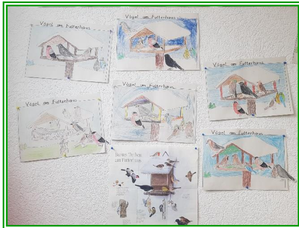
Unsere kleine Ausstellung